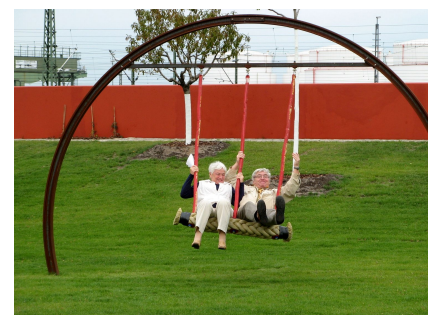
Ein Garten und Spielplatz für alle Generationen