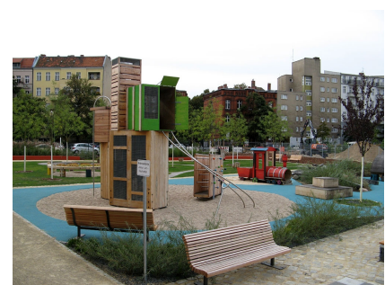
Der Spielplatz erinnert an den einstigen Güterbahnhof