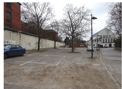
Die Flächen an der Gefängnismauer dienten zuvor als Parkplatz