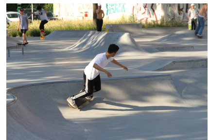
Der 1.000 qm große Skatepark wird intensiv genutzt