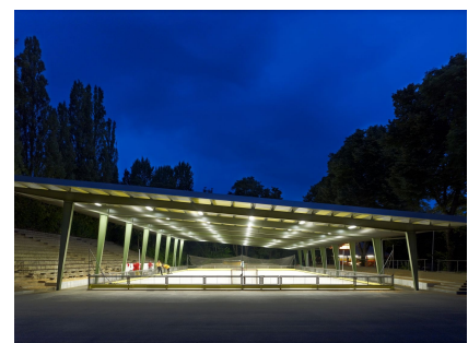
Auch in der Dunkelheit nutzbar und ein besonderer Blickfang - die Rollsportanlage