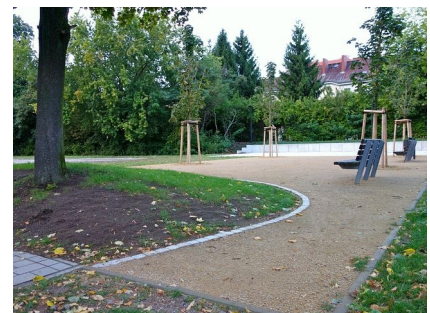
Blick auf die neue Boule-Fläche