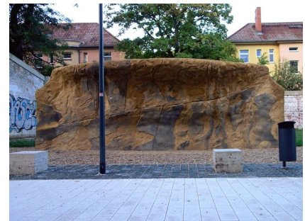
Der Kletterfelsen zum Bouldern (Querklettern) am neuen Süd-Ost-Eingang in den SportPark Poststadion

Neuer Eingang: 2009 bis 2010 Sportanlagen: 2012 bis 2013