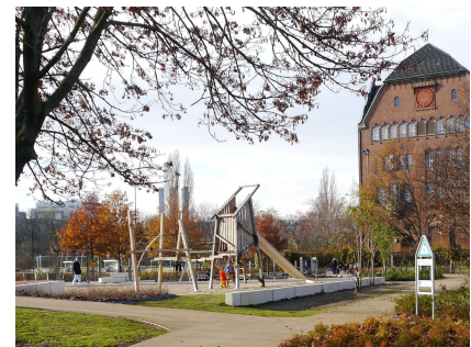
Die Spielfläche im Park am Neuen Ufer wurde erweitert