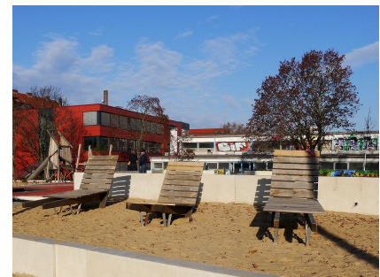
Wegeverbindungen sowie Aufenthaltsbereiche für alle Generationen kamen hinzu

Stand: August 2024