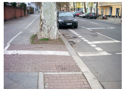
Zuvor war die Situation für Radfahrende unbefriedigend