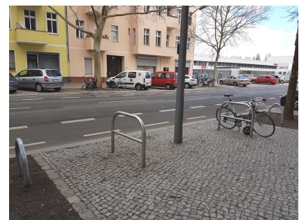
Sicherer Radstreifen und Kreuzberger Bügel