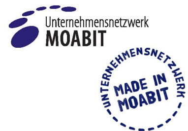
Logo des Unternehmensnetzwerks und der Kampagne "Made in Moabit"