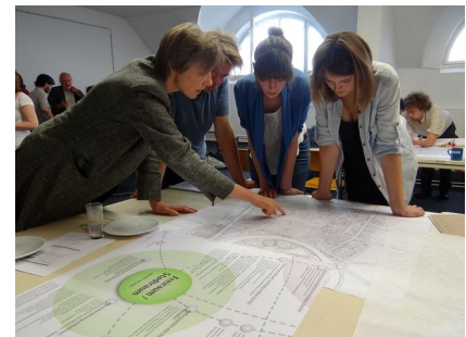
Das Konzept war auch Thema der Internationalen Studentischen Sommerakademie 2012