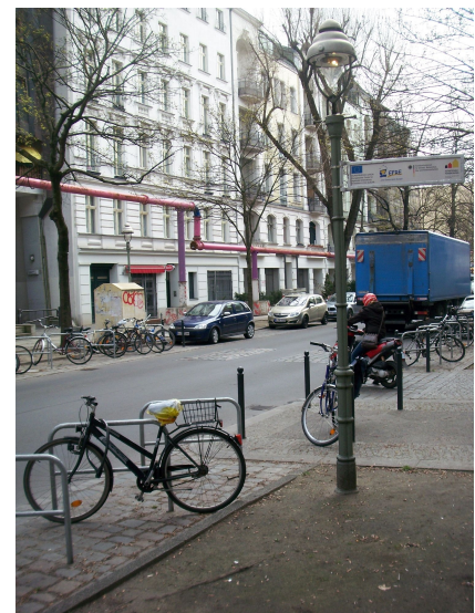
In der verkehrsberuhigten Lehrter Straße wird viel gebaut