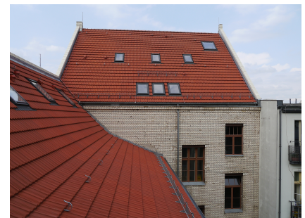
Dach und Hoffassaden nach denkmalgerechter Sanierung