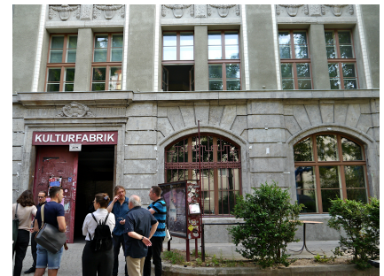
Die Außenhülle der Kulturfabrik an der Lehrter Straße wurde saniert