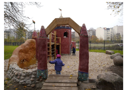
Die Burgruine ist auch für die Kleineren leicht zugänglich