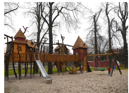
Räuberlager mit vielen Spiel- und Bewegungsangeboten

Quelle: Reif + Eberhard Landschaftsarchitekten, Fotos u. Bearbeitung: Anka Stahl Stand: April 2024