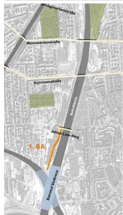
Lageplan mit dem südlichen Teil des Nord-Süd-Grünzugs als Teil der Schöneberger Schleife