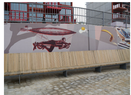
Lange Sonnenbank an der Rampe