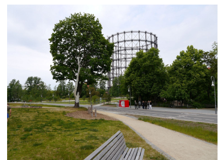
Rad- und Fußwege sowie Bewegungsangebote bilden den Grünzug Torgauer Straße als Teil der Schöneberger Schleife