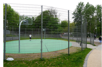
Basketballfläche am Grünzug Torgauer Straße