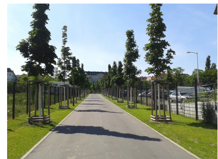
Der Ost-West-Grünzug verbindet Stadträume