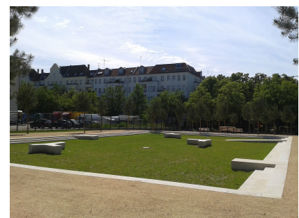
Die "Lichtung" als Multifunktionsfläche auf ehemaligen Gewerbeflächen