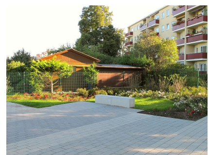
Kleine Aufenthaltsfläche in der Mitte der Promenade