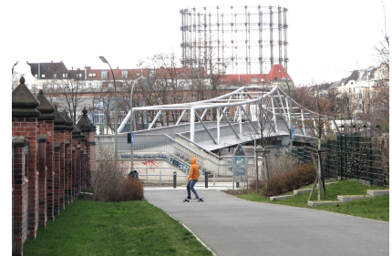
Übergang zum Alfred-Lion-Steg an der General-Pape-Straße