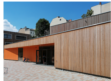
Die neue Sporthalle der Johannes-Schule