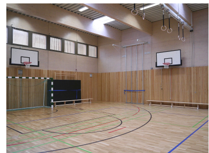
Konstruktion, Wandverkleidung und Sportparkett sind aus Holz