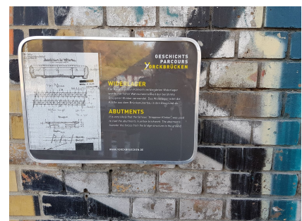
Objektschilder machen vor Ort auf historische Spuren aufmerksam