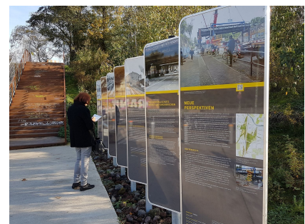
Am Informationsort bieten 7 Tafeln eine Einführung in verschiedene Themen