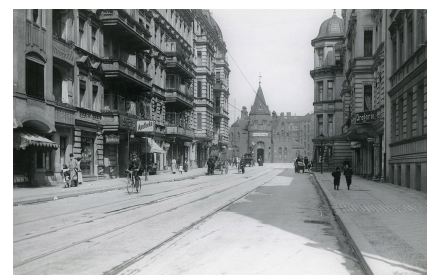
Historische Aufnahme der Sedanstraße, der heutigen Leberstraße