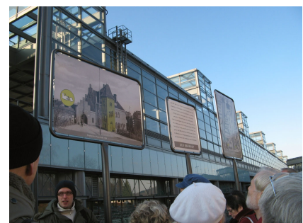
Am Bahnhof Südkreuz starten die Führungen entlang des Geschichtsparcours