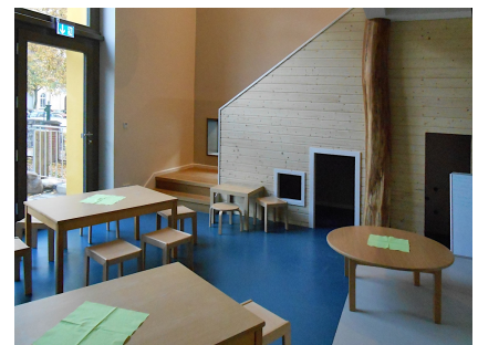
Farbenfroher Gruppenraum der Kita im ehemaligen Kirchenraum