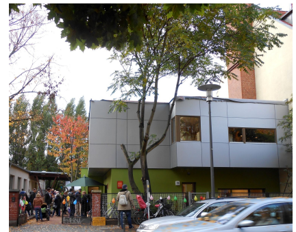
Die Fassade des JuFaZ an der Eitelstraße