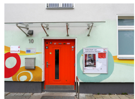
Das Ergebnis kann sich sehen lassen