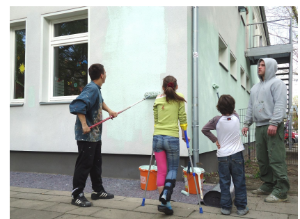
Kinder und Jugendliche halfen bei der Gestaltung