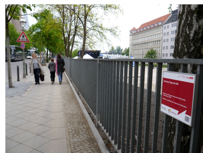
Der neue Gehweg auf der Westseite der Ziegrastraße schließt an die Uferpromenade an