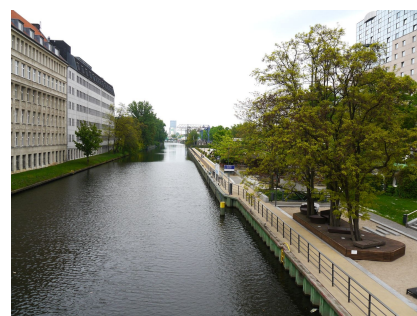
Blick von der Sonnenbrücke auf die gesamte Uferpromenade