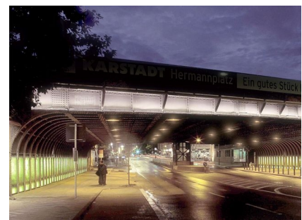
Das Neuköllner Tor in der Dämmerung

2008 - Neuköllner Tor, 2011 - Mittelinsel