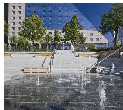
und im Licht attraktiv - die Treppe Sonnenbrücke