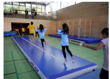
Die moderne Ausstattung der Halle hat der Bezirk Neukölln finanziert