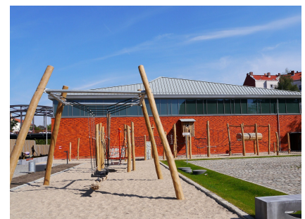
Der Spielparcours vor der neuen Sporthalle