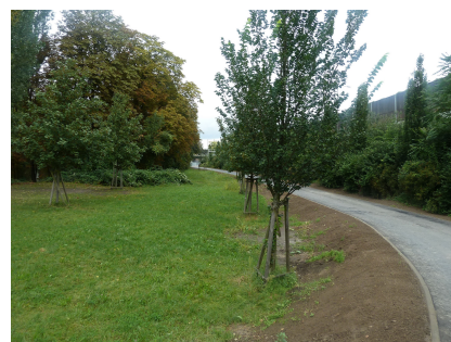
Der Weg verläuft abgesichert von der Autobahn A 100/A113