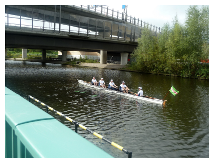
Blick vom Weg auf den Neuköllner Schifffahrtskanal und die Autobahnbrücke