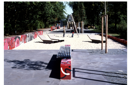
Das Sport- und Spielband