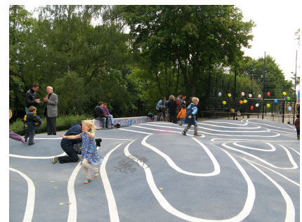
Die neue Eingangsgestaltung an der Straße "Vor dem Schlesischen Tor"