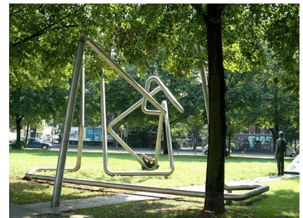
Die Grünfläche zwischen Oberbaumstraße und May-Ayim-Ufer