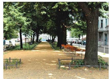
Die erneuerte Bevernpromenade