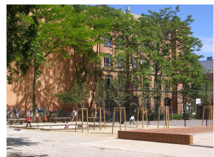
Der neue Pavillonhof