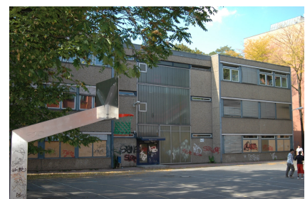
Dieser Anbau wurde abgerissen