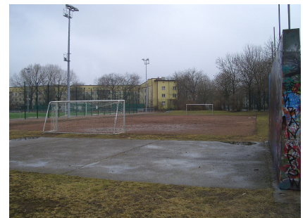
Zuvor gab es nur einen Bolzplatz