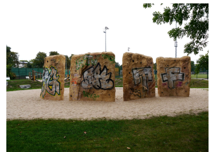
Künstliche Felsen zum Bouldern