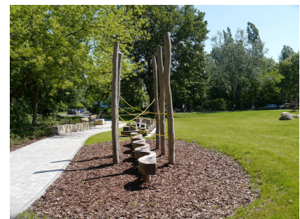
Die Motorikstrecke im idyllischen Quartierspark