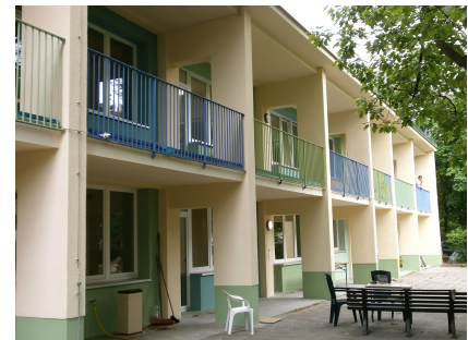
Loggien an der Gartenfassade