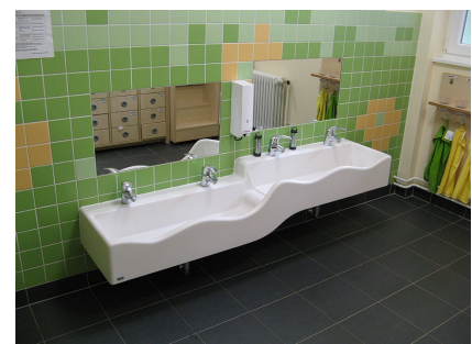
Neuer Waschraum mit Köpfchen eingerichtet