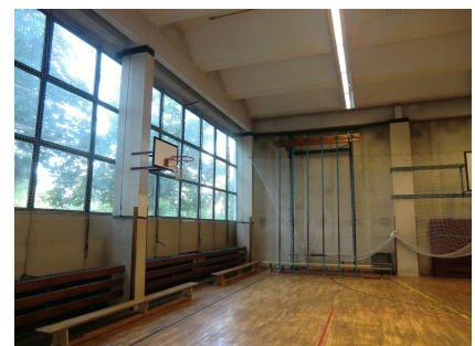
Die Halle vor Projektbeginn