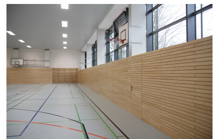
Das Innere der Halle wurde mit Stadtumbaumitteln saniert