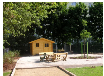
Das Gartenhaus mit Terrasse, Tisch und Bänken