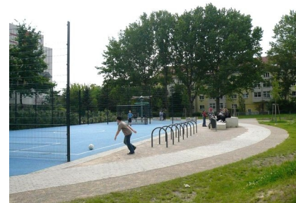
Bolzplatz im Zentrum des Quartiersparks