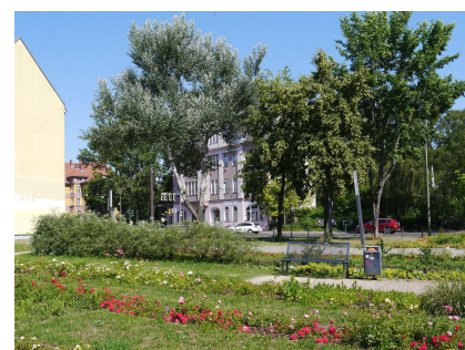
Grünfläche mit Bänken und Blick zur Hauptstraße