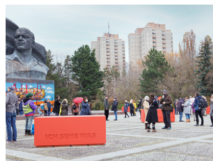
Denkmal mit den Sockeln als künstlerische Kommentierung am Tag der Enthüllung