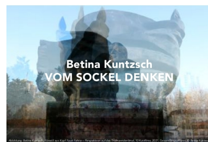
Teil der Kommentierung sind 10 Filme, die über QR-Codes vor Ort abrufbar sind