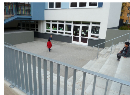
Das neue Atrium vor der Mensa im Souterrain