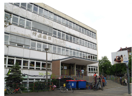
Die Schule vor Baubeginn