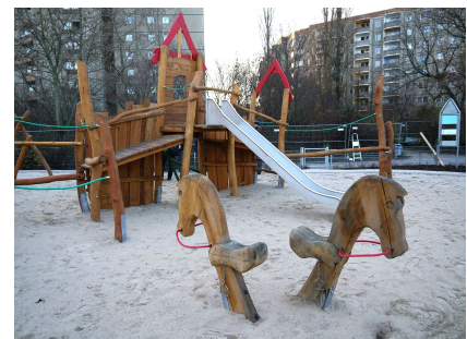
Hölzerne Pferde passen zum Märchenschloss