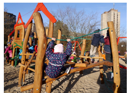
Der Kletter- und Hangelparcours verlangt Geschicklichkeit