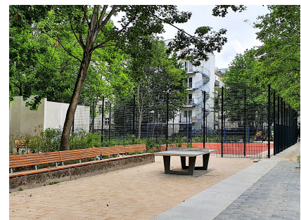
Sitzplatz an der Tischtennisplatte