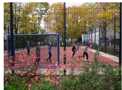
Das neue Kunststoff-Spielfeld