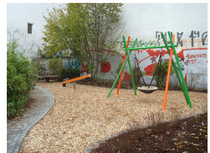
Der Dschungelspielplatz für die kleineren Kinder