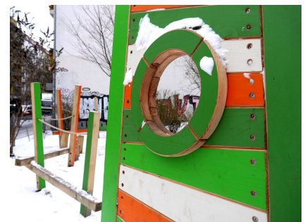
Detail des Kletterparcours auf dem Dschungelspielplatz

Stand: April 2024