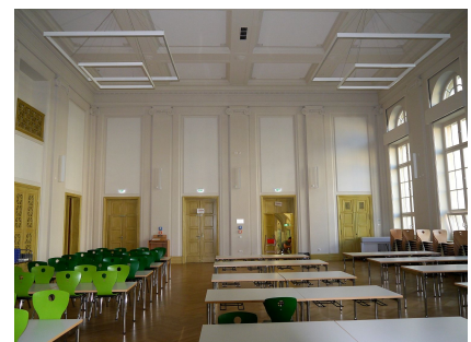
Die denkmalgetreu sanierte Aula wird auch als Mensa genutzt