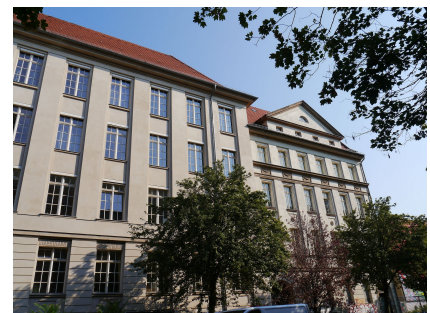
Die sanierte Fassade des über hundertjährigen Gebäudes