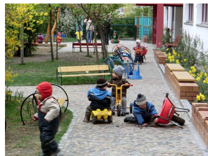
Befestigter Weg am Haus für alle Spielfahrzeuge