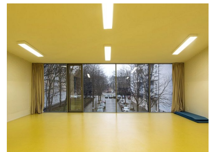
Der Bewegungsraum im neuen Obergeschoss der Casa Blu