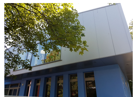
Die Aufstockung am Eingang Hans-Otto-Straße