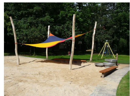
"Vogeltränke" mit Sonnensegel