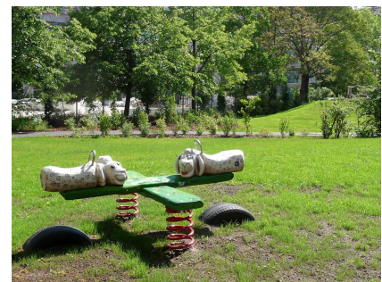
Neue Wippe auf dem "Bauernhof"