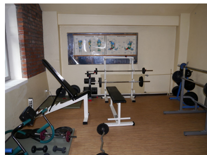
Alle Wände wurden gestrichen. Der Sportraum erhielt einen neuen Bodenbelag