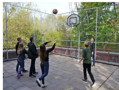
Die neue Basketballfläche mit Ballfangzaun