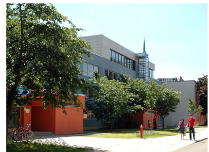
Das Gebäude wurde saniert und aufgestockt