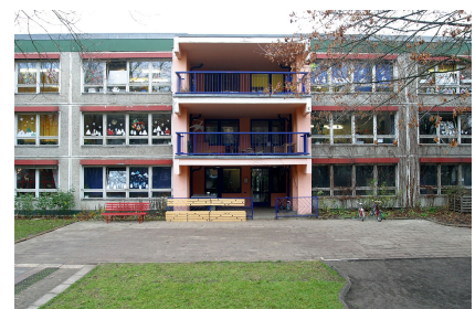
Die Fassade an der Gartenseite vor Projektbeginn