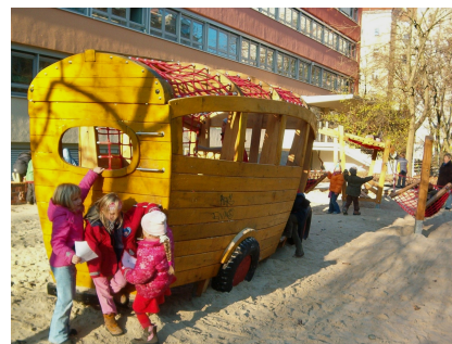
Ein Bus im Sand mit vielen Spielmöglichkeiten