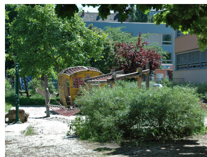
Im Vorgarten gibt es viele grüne Verstecke