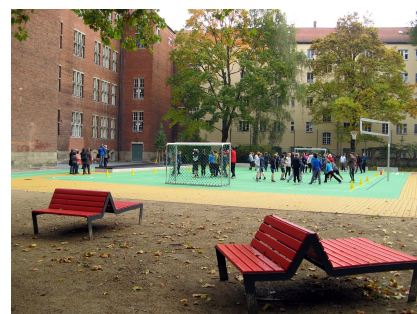
Sport- und Chillmöglichkeiten auf dem neuen Schulhof