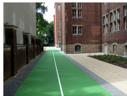
Die Laufbahn wurde optimal eingepasst