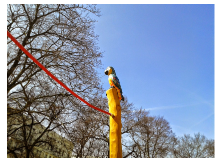
Detail am aufgewerteten Helmholtzplatz