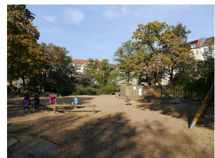
Der Helmholtzplatz vor der Qualifizierung

Quelle: Bezirksamt Pankow, Bearbeitung u. Fotos: Anka Stahl Stand: April 2024